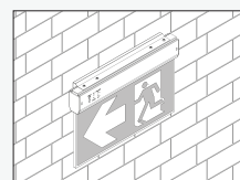
Wall (Type W) (installation with kit included)